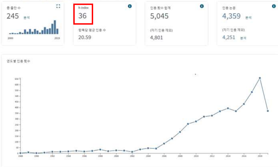
OOO 박사 연도별 논문인용 횟수 및 H-index (Web of Science)